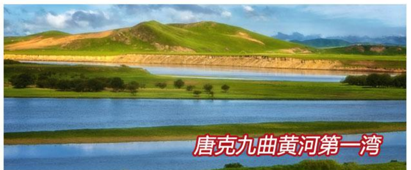
唐克九曲黄河第一湾